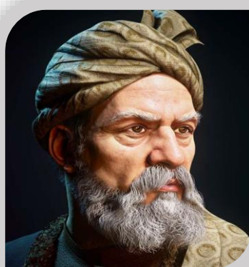
۲۵ اردیبهشت روز بزرگداشت حکیم ابوالقاسم فردوسی