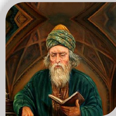
۲۵ فروردین روز بزرگداشت حکیم محمد عطار نیشابوری