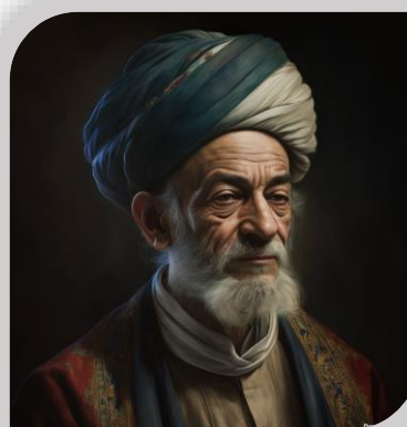
۱ اردیبهشت روز بزرگداشت شیخ اجل سعدی شیرازی